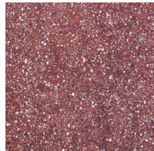
گرانیت قرمز یزد (G3)