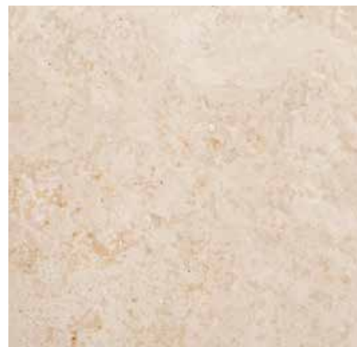
تراورتن سفیدابیانه (T2)