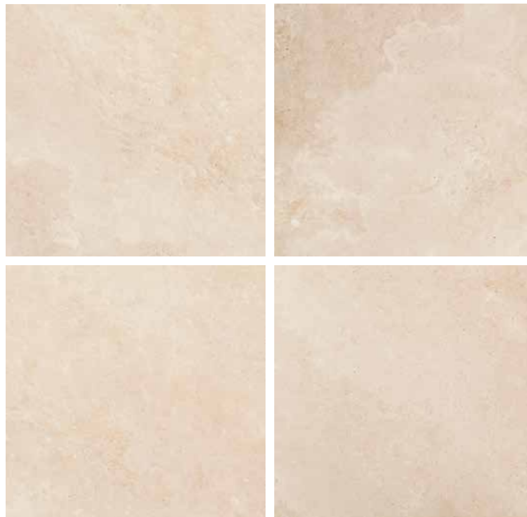
تراورتن سفید ابیانه (T1)