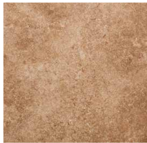
تراورتن شکلاتی کاشان